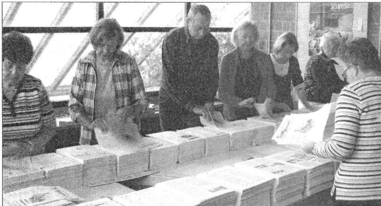
Viele ehrenamtliche Helfer sind beteiligt, wenn die Bewohnerzeitung in Neugereut verlegt wird, bevor sie sie dann heften und verteilen.

■ Neugereut: Seit 1972 gibt es die Bewohnerzeitung – 60 Ehrenamtliche helfen regelmäßig mit